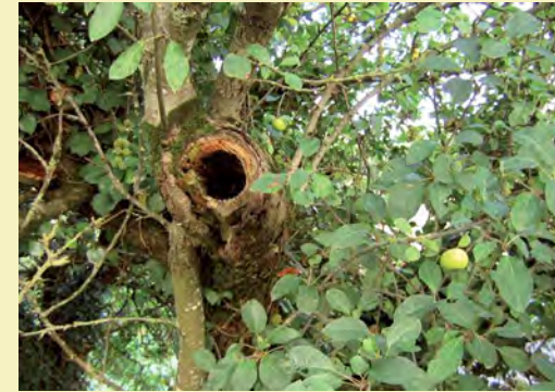
▲ Pommier dont une branche s'est creusée