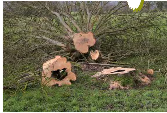
▲ La coupe systématique des arbres têtards creux est une cause de disparition des sites de nidification

Si la fouine est un prédateur naturel, qui a toujours existé, la chevêche fait de plus en plus souvent les frais de chats et de chiens laissés sans surveillance. De plus, un hiver très rigoureux ou un printemps trop pluvieux peuvent compromettre la reproduction.