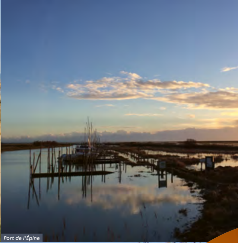
Port de l'Épine