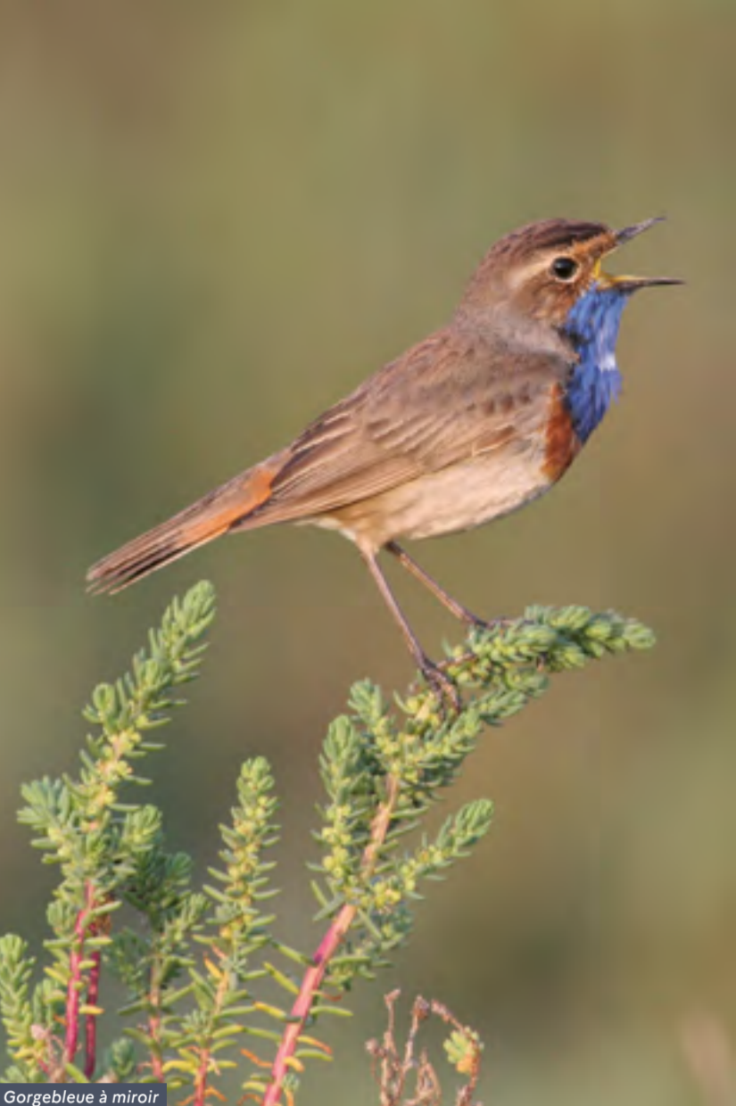
Gorgebleue à miroir

Des sorties nature et animations sont proposées sur une bonne partie de ces sites, vous pouvez les retrouver sur : www.lpo.fr et vendee.lpo.fr