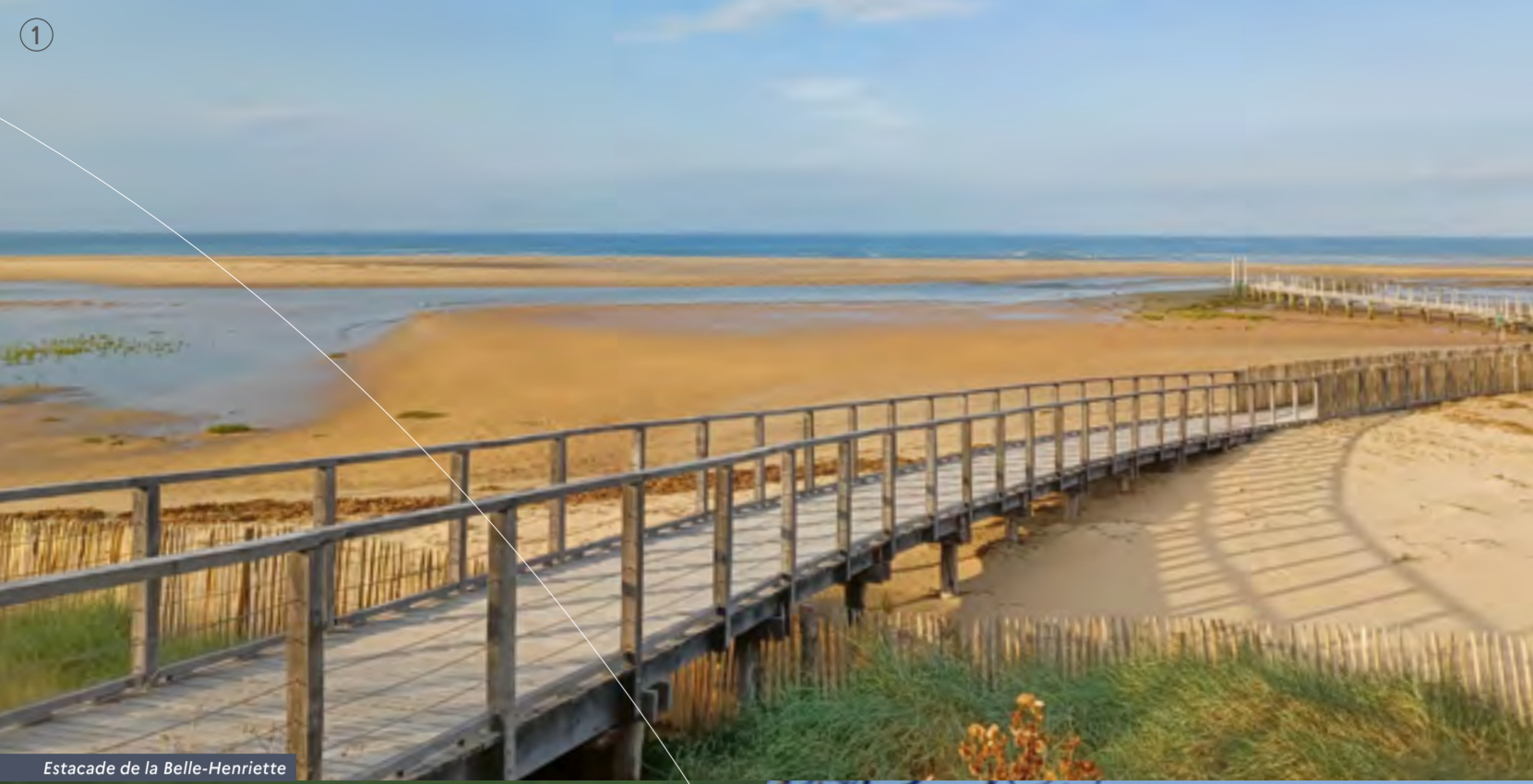
Estacade de la Belle-Henriette