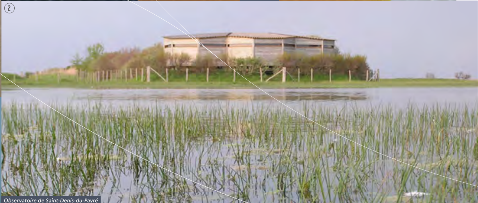
Observatoire de Saint-Denis-du-Payré