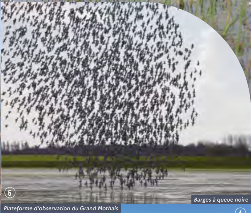
Plateforme d'observation du Grand Mothais