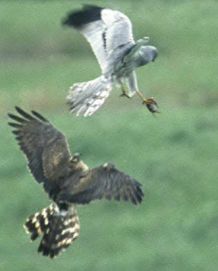
Mâle de busard des roseaux