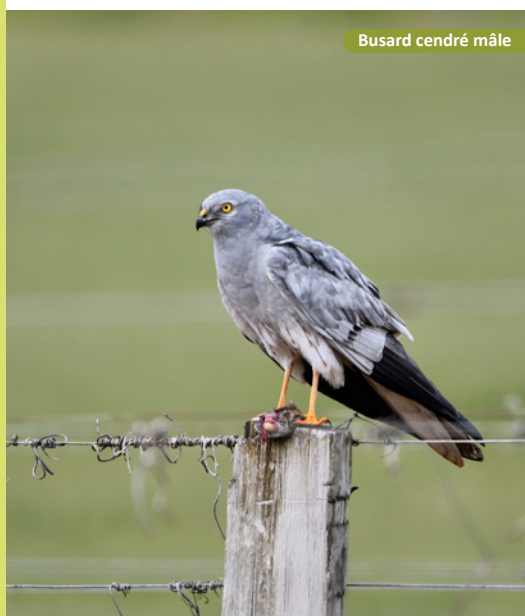
Busard cendré mâle

La participation des agriculteurs est très précieuse car elle fait gagner beaucoup de temps et permet d'agir efficacement.