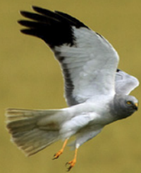
Mâle de busard Saint-Martin Mâle et femelle de busard cendré

Le busard cendré, migrateur, est présent d'avril à septembre et passe l'hiver en Afrique. Le busard Saint-Martin et le busard des roseaux sont présents toute l'année.